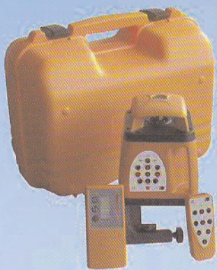
Bestell-Nr. 460 962-613

Grüner Laserstrahl für optimale Sichtbarkeit