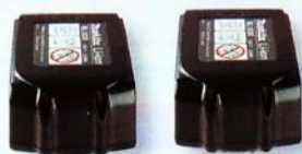
2 Lithium-Ionen Akkus 14,4 V bzw. 18V / 3,0 Ah